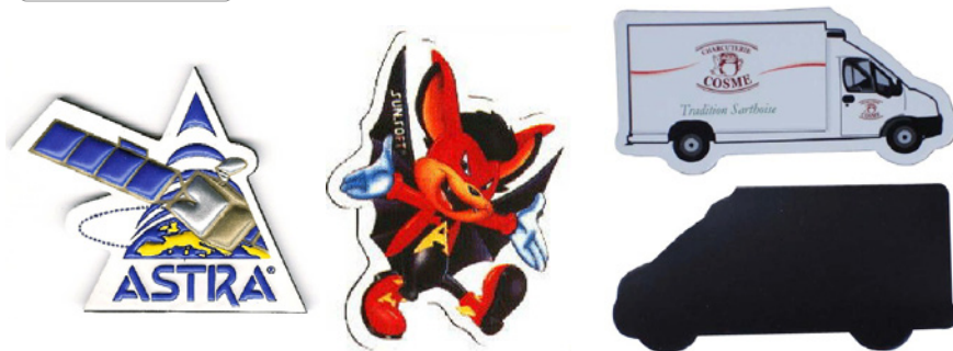
Magnete ideal für Mailings