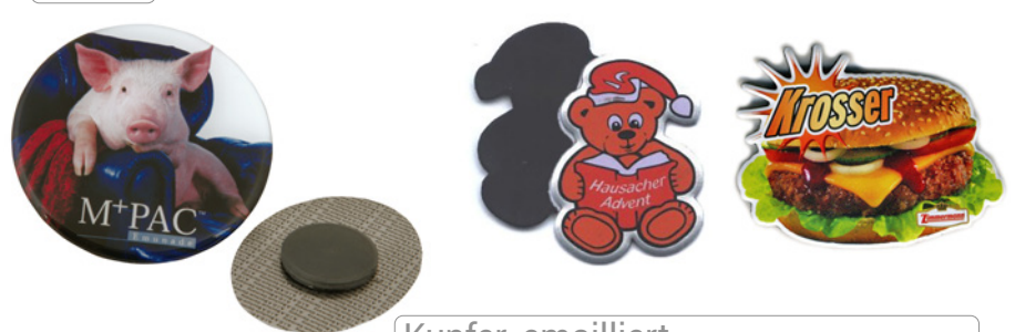
Kupfer, emailliert Aluminium oder Edelstahl, bedruckt mit Rundmagnet oder Magnetfolie