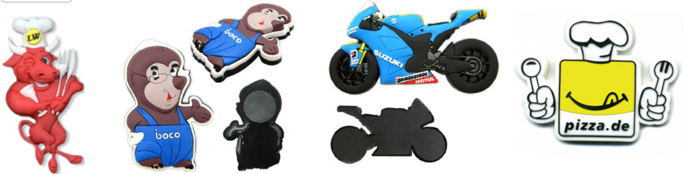
Magnete im Relief-, 2D- oder 3D Design