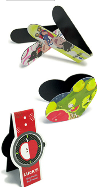
Magnetfolie mit laminiertem Papier