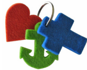
nach Kundenwunsch gestanzt